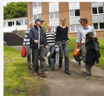
Auf zum Segeln